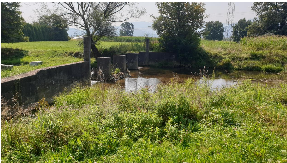
Foto 8. Jez na Ložnici