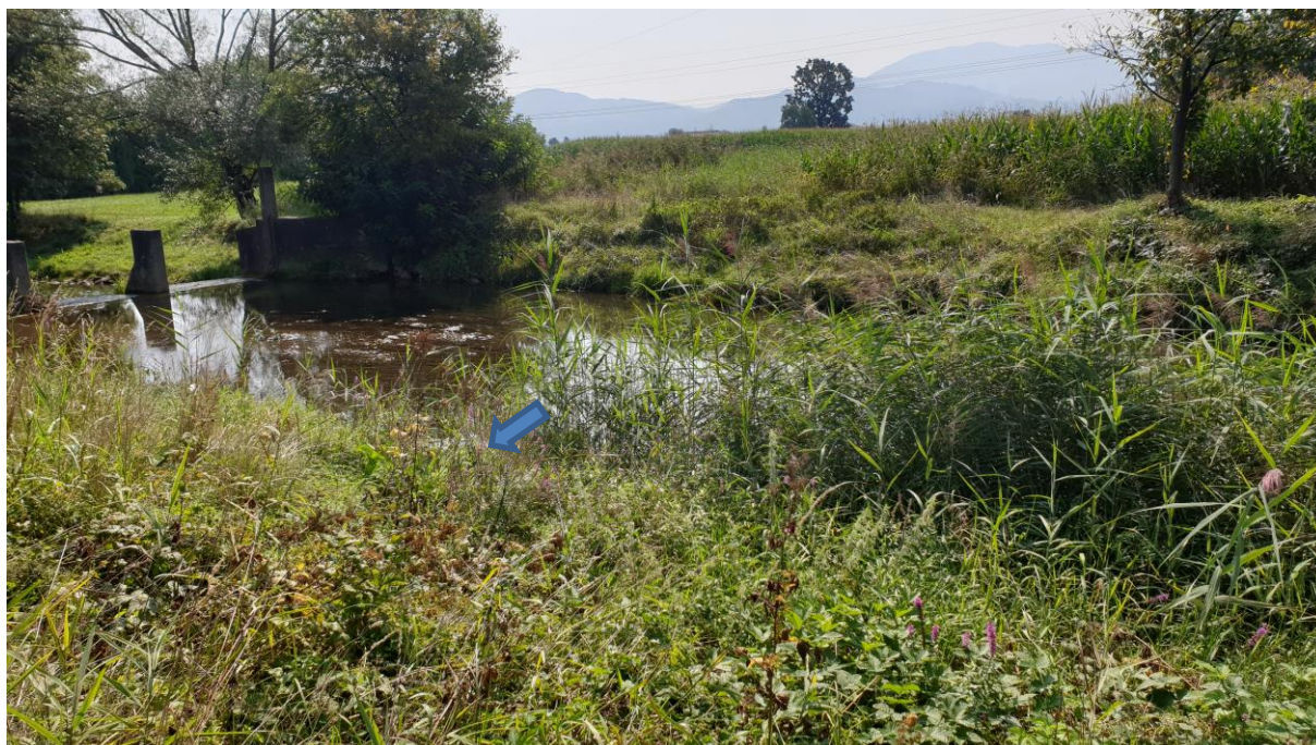
Foto 9. Lokacija iztoka odprtega jarka meteorne vode v Ložnico